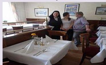
PRZYGOTOWUJE I PODAJE ŚNIADANIA W OBIEKCIE ŚWIADCZĄCYM USŁUGI HOTELARSKIE