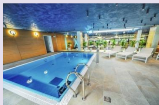
PRZYJMUJE I REALIZUJE ZAMÓWIENIA NA USŁUGI DODATKOWE