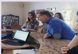
REZERWUJE USŁUGI HOTELARSKIE