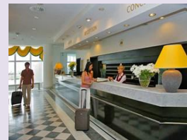
WYKONUJE PRACE ZWIĄZANE Z OBSŁUGĄ GOŚCI W RECEPCJI