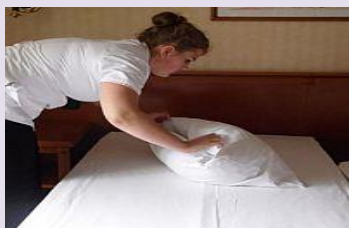
PRZYGOTOWUJE JEDNOSTKĘ MIESZKALNĄ DO PRZYJĘCIA GOŚCI